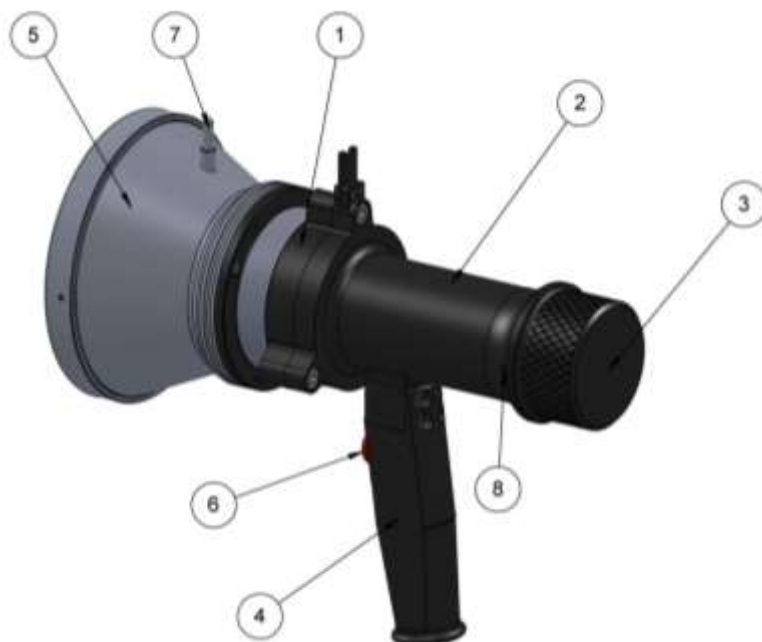
Рис. 1. Имитатор пламени (вид сбоку)